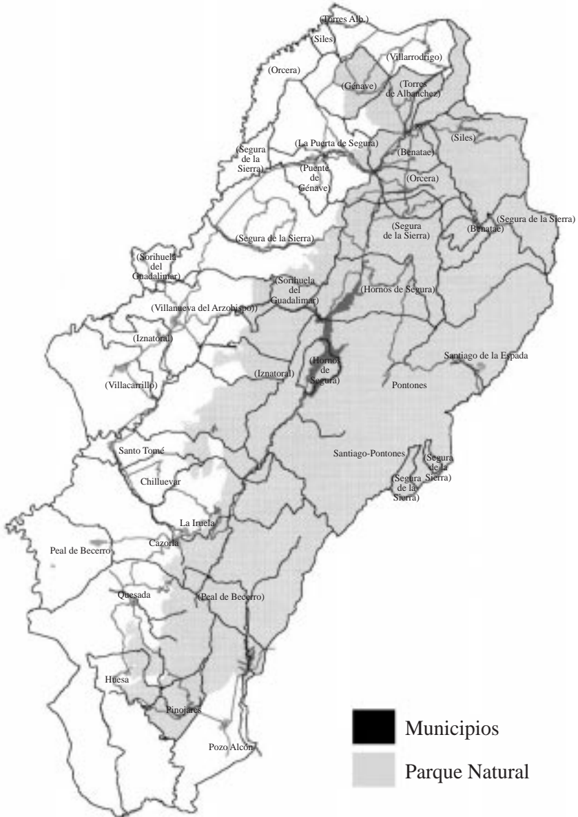
MAPA 1. MUNICIPIOS INCLUIDOS EN EL PARQUE NACIONAL DE LA SIERRA DE CAZORLA, SEGURA Y LAS VILLAS